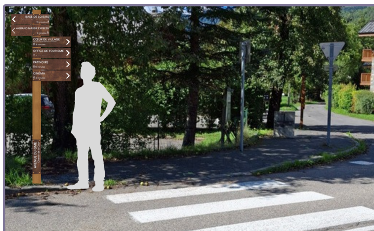
Cette esquisse ne tient pas compte de l'orientation des lames.

L'objectif est de faciliter les déplacements à pied dans le village, d'encourager le stationnement en périphérie et de permettre aux visiteurs comme aux habitants de rejoindre facilement les lieux clés.