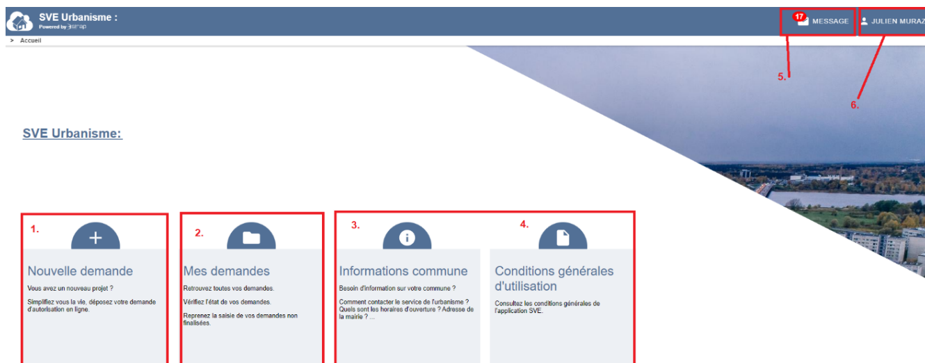
Interface générale du portail SVE